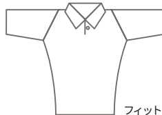
フィットスタイル