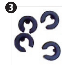
ストラップベルト接続部品止め