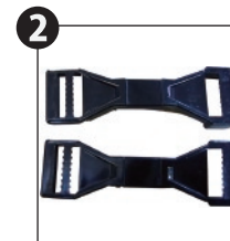
ストラップベルト接続部品